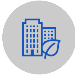
PIANO STRUTTURALE COMUNALE (PSC)