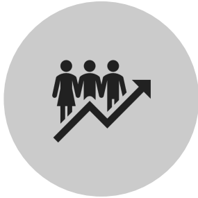
PIANO REGOLATORE GENERALE (PRG)