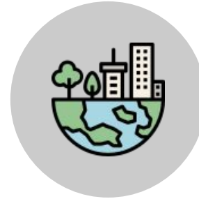
PIANO URBANISTICO GENERALE (PUG)