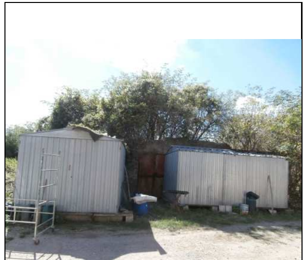
BZ042011 fienile crollato.j